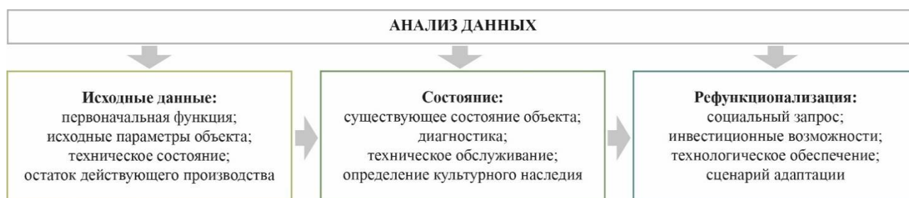
Рис. 2. Цикл повторной адаптации индустриальной архитектуры

Моделирование объектов на различных стадиях проектирования предполагает определение закономерностей, свойственных цикличности жизни здания, и способствует формированию обоснованных суждений о возможных состояниях и перспективах развития того или иного сценария в будущем. Одной из центральных задач таких исследований является получение оптимальных методов и решений для разработки наиболее эффективного функционального назначения, а также обеспечение наиболее подходящих эксплуатационных условий бывших индустриальных объектов. В соответствии с принципами целостности [14], разработка математической модели рефункционализации промышленной архитектуры, основанной на применении современных принципов архитектурного проектирования и математических методов, позволяет в дальнейшем решить художественные, технологические, социальные и экономические проблемы для обеспечения эффективного развития как отдельно изучаемого объекта, так и влияние его развития на структуру города в целом. В результате исследования данной модели с применением различных математических методов, численной обработки данных и информационных вычислений, основываясь на идентичности трактовки этой модели в реальных условиях, мы получаем реализуемый сценарий взаимодействия с объектом на практике [42].