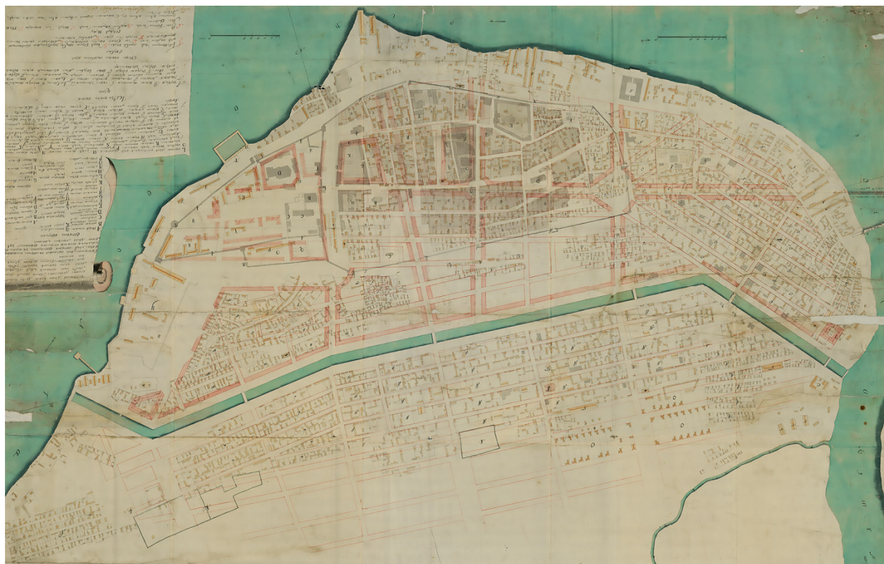
Рис. 1. План города Астрахани. Архитектор Андрей Меньшой. Ноябрь 1767 года. [РГИА. Ф.1293. Оп.168. Астраханская губерния. Д.27]. Публикуется впервые

А. Меньшов сохранил регулярные кварталы Старо-Армянской слободы и четкую структуру заканальной части с прямоугольными кварталами. Выровняв ширину шести кварталов от берега канала, архитектор запроектировал линию кварталов более широких. Именно эти габариты были сохранены в последующем расширении территории на юг по генеральному плану А. Дигби 1801 года. На генплане 1767 года изображены вновь проектируемые жилые дома с Г-образным планом.