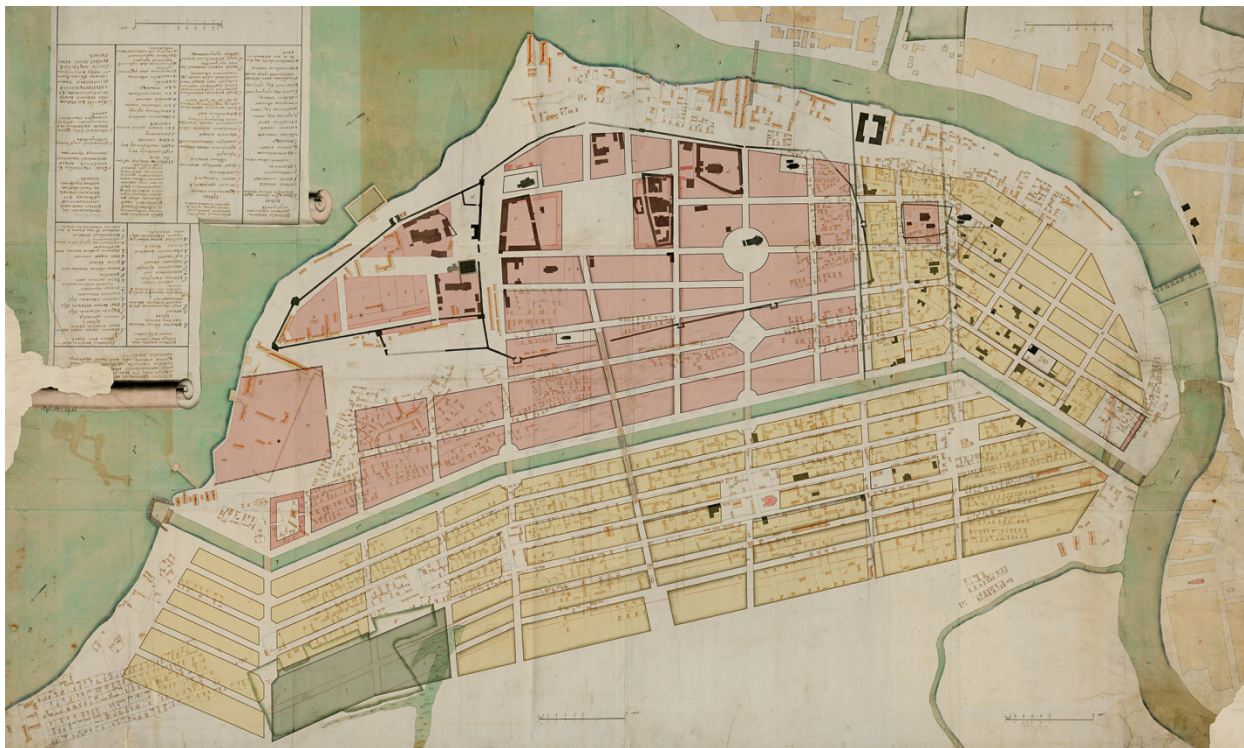
Рис. 5. План гор. Астрахани (отредактированный лист с выделением кварталов под каменные и деревянные строения по плану, Высочайше подтвержденному 26 марта 1769 года). [РГИА. Ф.1293. Оп.168. Астраханская губерния. Д.25]. Публикуется впервые

ул. Дарвина) столичные проектировщики не считали нужным.