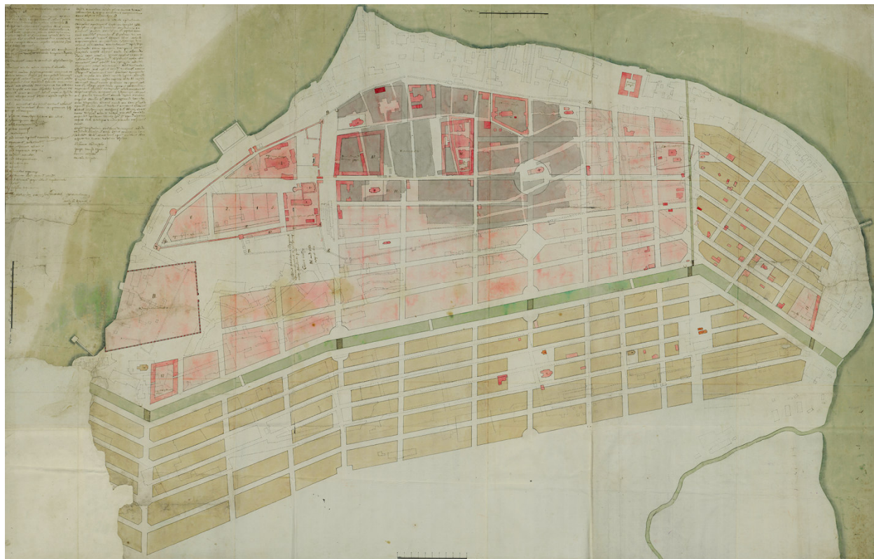
Рис. 4. План города Астрахани, Высочайше подтвержденный 26 мая 1768 года. Архитектор А.В. Квасов. [РГИА. Ф.1399. Оп.1. Д.253]

антских складов, а на территории бывшего Житного двора – торговых лавок. По инициативе губернатора Троицкий монастырь в Кремле был упразднен в 1764 году и его помещения приспособлены для гарнизонной школы (которая и зафиксирована на планах), располагавшейся здесь с 1765 по 1785 год [33].