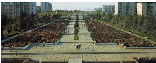
Рис. 3. Бульвар Дружбы (Аллея Роз), г. Ростов-на-Дону, 1974 г. [11]

Бульвар Дружбы протянулся узкой полосой между пятиэтажными жилыми домами, соединяя площадь им. города Плевен с Краснодарской улицей (рис. 3). В 1970 г. жители Плевна сделали ростовчанам подарок: привезли в Ростов-на-Дону 5000 саженцев болгарских роз [10], которые были использованы для благоустройства территории плевенского ансамбля, благодаря чему на бульваре Дружбы появилась Аллея Роз. Ограниченный с двух сторон транспортными проездами бульвар стал своеобразным аналогом «парковой дороги».