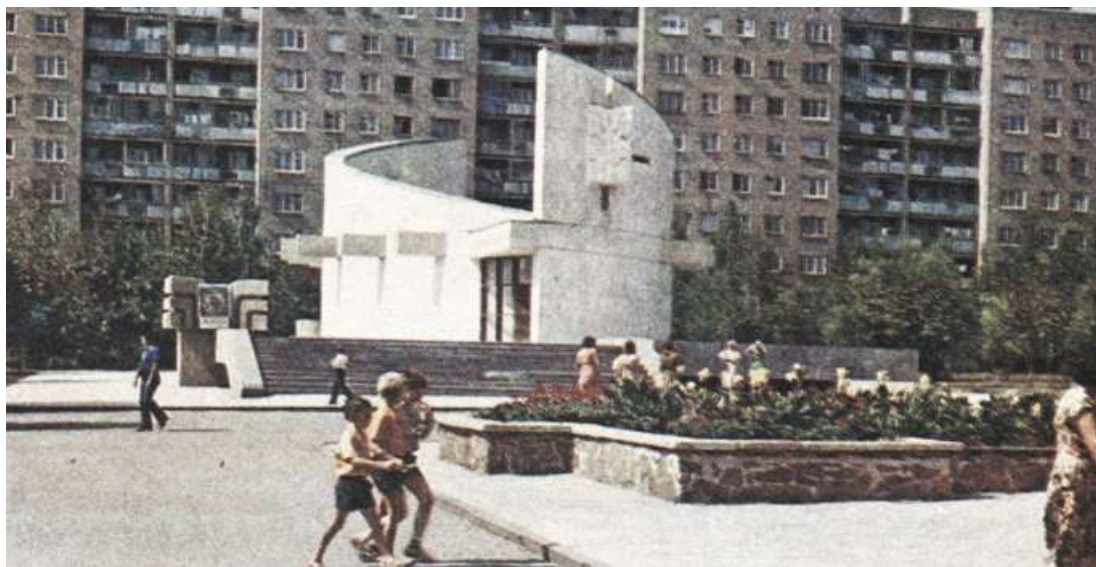
Рис. 5. Музей интернациональной дружбы, парк им. города Плевен, г. Ростов-на-Дону, 1970-е гг. [14]

кровлей противопоставлены сложной геометризированной в плане цветочной клумбе. Она расположена непосредственно на пересечении главной и второстепенной осей парка, фиксируя планировочный центр территории. В настоящее время пространственная организация парковой площади утеряна: музей стал частью ресторанного комплекса, к которому со стороны парка примыкает сцена; на месте клумбы расположен овалообразный фонтан; вместо памятника размещены торговые киоски (рис. 6).