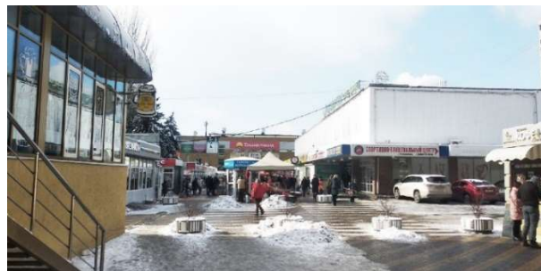
Рис. 9. Бывшее здание универсама в ЗЖМ, г. Ростов-на-Дону, 2020 г.

и 800 мест и просторных холлов теперь размещены 5 небольших кинозалов и множество маленьких помещений кафе и торговых магазинов.