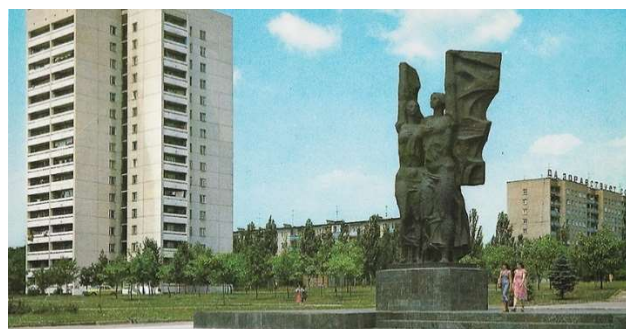
Рис. 4. Памятник советско-болгарской дружбе, площадь им. города Плевен, г. Ростов-на-Дону, 1981 г. [13]

линии бульвара Дружбы (см. рис. 2). Пространственно этот перенос зафиксирован с помощью расположенного в центре площади монумента советско-болгарской дружбы, открытого 10 сентября 1974 г. (рис. 4). Авторами памятника стали болгарский скульптор Цонков Д. и ростовский архитектор Бельченко Б.Г. [12].