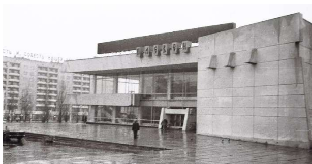
Рис. 8. Кинотеатр «Плевен», г. Ростов-на-Дону, 1980-е гг. [19]

В настоящее время в здании универсама расположен супермаркет «Перекресток», а также ряд небольших торговых павильонов. Второй этаж облицован пластиковыми панелями, козырек закрыт рекламой (рис. 9). Кинотеатр «Плевен» практически невозможно узнать. Теперь это часть торгово-развлекательного центра, включающего не только кинотеатр, но и предприятия торгово-бытовой сферы. Чистые формы старого здания закрыты кассетными панелями различных цветов, витражи увешаны рекламой, появилась надстройка третьего этажа (рис. 10). Кардинально поменялась внутренняя структура сооружения, где вместо двух зрительных залов на 300