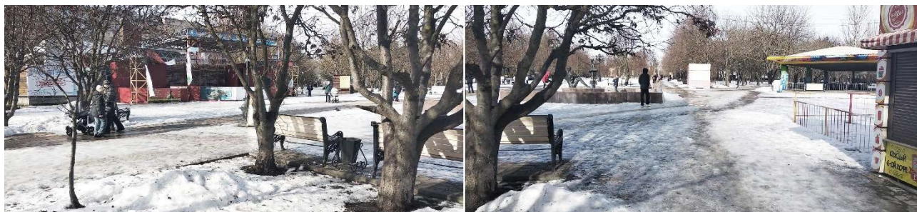
Рис. 6. Центральная площадь парка им. города Плевен, г. Ростов-на-Дону, 2020 г.

Озелененная пешеходная зона, примыкающая к парку вдоль Коммунистического проспекта, сформирована 4 элементами: зданиями кинотеатра и универсама, площадью с фонтаном между ними и пешеходным бульваром вдоль дороги (см. рис. 2). Первый универсам в Ростове-на-Дону площадью 1200 кв.м. открылся в ЗЖМ в декабре 1973 г. и стал самым передовым торговым предприятием города: здесь использовались новейшая система самообслуживания, лучшее отечественное и зарубежное оборудование и производственная техника [15]. Двухэтажный объем, в основе которого заложена типичная для унифицированного проектирования 1970-х гг. каркасная конструктивная система, представляет собой строгий параллелепипед, сочетающий легкое