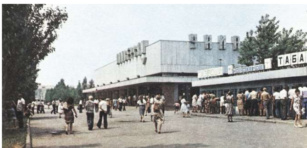
Рис. 7. Универсам в ЗЖМ, г. Ростов-на-Дону, 1980-е гг. [14]