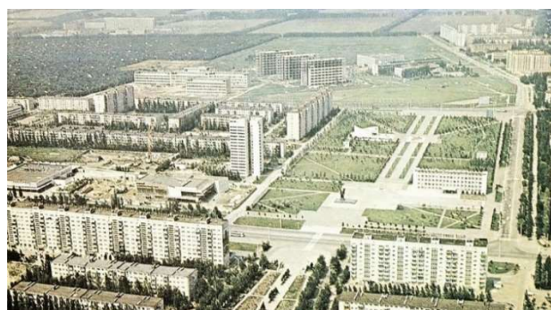
Рис. 1. Строительство ЗЖМ, г. Ростов-на-Дону, 1970-е гг. [9]

Генеральный план Ростова-на-Дону, одобренный правительством в 1971 г. [7], предполагал строительство Западного Жилого Массива (ЗЖМ) как самого передового района города, в основу которого заложены новые прогрессивные приемы планировки, предполагающие зонирование территории на кварталы площадью 40–50 гектар [8]. Такие размеры позволили архитекторам предусмотреть в каждой жилой зоне размещение необходимого комплекса объектов различных функциональных сфер, удовлетворяющих потребности жителей: бытовые, культурные, рекреационные, учебные, детские, спортивные, лечебные. Отличительной чертой ЗЖМ стало обильное количество скверов-садов, парков и бульваров (рис. 1).