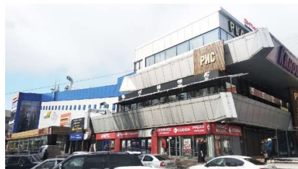
Рис. 10. Бывшее здание кинотеатра «Плевен», г. Ростов-на-Дону, 2020 г.

Современное состояние плевенского ансамбля характеризуется отсутствием пространственных связей между его основными составляющими и, как следствие, утратой эстетической ценности городской среды. Форма парковой площади изменена, т.к. утрачен один из ее важнейших элементов – здание музея; потеряны второстепенные осевые направления; нарушено соотношение плотность – разреженность в рекреационной зоне. Парк перестал быть местом скопления горожан, а превратился в транзитную зону между проспектами. В 1996 г. у входа в парк со стороны проспекта Стачки был установлен памятник воинам, погибшим в локальных конфликтах, а в 2015 г. – у основания Аллеи Роз, выходящему к Коммунистическому проспекту, открыли памятник солдатам Победы. Вместе с монументом советско-болгарской дружбы они расположены на одной оси, параллельной главной аллее парка (рис. 11). Однако утерянный центральный элемент пространственной организации не позволяет проследить эту связь.