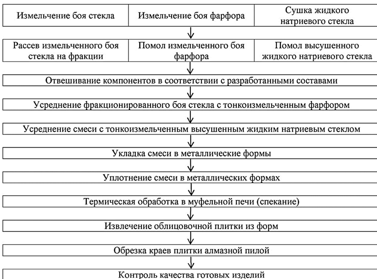
Рис. 2. Технология получения композиционного стеклокристаллического облицовочного материала