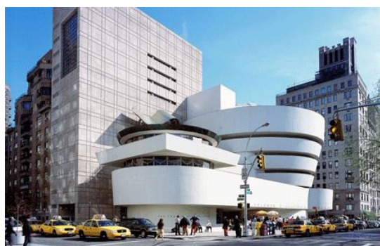
Рис. 2. Музей Соломона Гуггенхайма, Нью-Йорк

2. Принцип эстетической гармонизации (рис. 3) Гармония – является одной из основных категорий эстетики. Гармонизация в дизайне – это связь отдельных частей, формальных элементов, это соподчинение смысла и формы, внутреннего и внешнего. Гармонизация находится в подчинении общекультурных понятий и ценностей. Она наделяет изделие признаками, которые отвечают мере, пропорциональности, симметрии. Изделие становится частью мира и окружающей среды, гармонично вписывается в действительность.