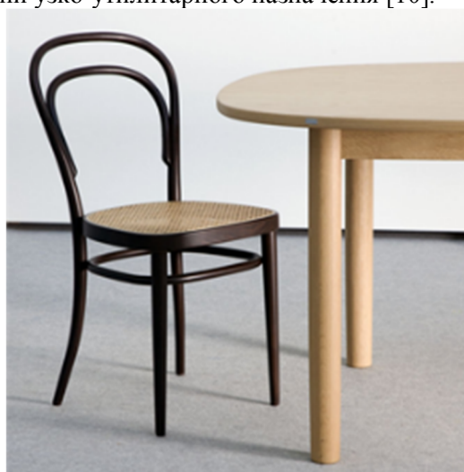
Рис. 4. Венский стул, Михаэль Тонет

3. Принцип эстетической целесообразности (рис. 4) Вся деятельность человека целесообразна. Каждый компонент целого, как и само целое, должен быть всегда оправдан какой-либо целью, должен иметь назначение. Когда человек начинает какое-то дело, он изначально представляет себе конечную цель, результат к которому идёт. Поэтому в самом начале, при зарождении идеи, человек рассматривает предстоящую деятельность с точки зрения целесообразности. Однако если подчиниться лишь целесообразности, формообразование лишается своей креативной стороны, становится предсказуемым и банальным. Полезное не должно исключать красоты и совершенства, это необходимые условия эстетической целесообразности. Мировое наследие свидетельствует, что большое количество прекрасных изделий было создано по принципу эстетической целесообразности, то есть предметы, наделённые полезными свойствами, были ещё и красивы, доставляли человеку своим внешним видом эстетическое удовольствие, обращались к внутреннему миру потребителя, расширяя свои грани узко-утилитарного назначения [10].