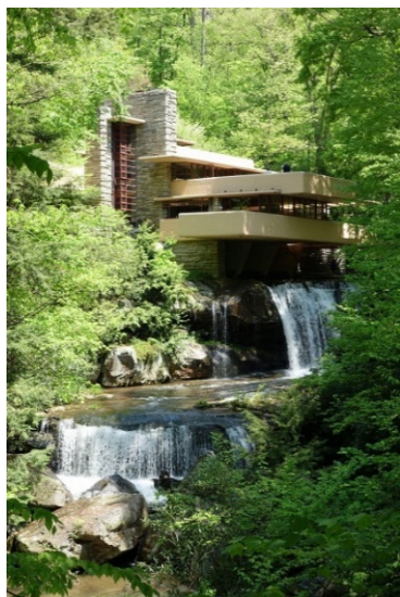
Рис. 3. Дом над водопадом, архитектор Ф.Л. Райт

2. Принцип эстетической гармонизации (рис. 3) Гармония – является одной из основных категорий эстетики. Гармонизация в дизайне – это связь отдельных частей, формальных элементов, это соподчинение смысла и формы, внутреннего и внешнего. Гармонизация находится в подчинении общекультурных понятий и ценностей. Она наделяет изделие признаками, которые отвечают мере, пропорциональности, симметрии. Изделие становится частью мира и окружающей среды, гармонично вписывается в действительность.