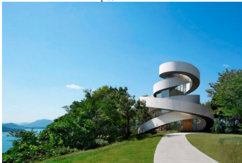
Рис. 5. Свадебная часовня Ribbon Chapel (часовня-«лента») Хиросиме, Хироси Накамура

мета. Она определяется не объективными, а субъективными причинами. Для производителя важной задачей становится – вызвать у потребителя определённые эмоции. Существует набор выразительных средств, который дизайнер использует для достижения этой цели – это фактура, пластика, цвет, тектоника. Принцип эстетической выразительности – это выражение гармонии и целостности.