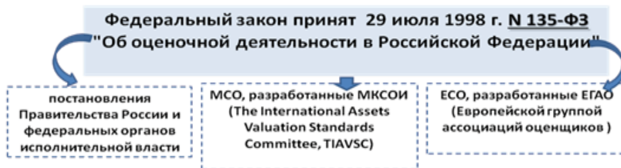
Рис. 1. Нормативно-правовая основа оценочной деятельности

Отметим, что некоторые нормы Закона закреплены на основании положений Международных стандартов оценки, разработанных Международным комитетом по стандартам оценки имущества (МКСОИ, The International Assets Valuation Standards Committee, TIAVSC). Кроме того, Европейской группой ассоциаций оценщиков (ЕГАО) приняты Европейские стандарты оценки (ЕСО) (рис. 1) [3, 4].