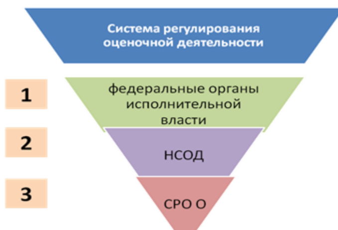
Рис. 3. Регулирование оценочной деятельности

Законом об оценке проведена четкая грань между тремя уровнями системы регулирования оценочной деятельности и строго разграничены полномочия в этой сфере (рис. 3).