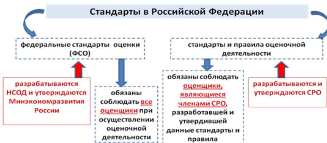
Рис. 2. Стандарты оценочной деятельности

ночной деятельности, разрабатываемые и утверждаемые СРО (рис. 2) [7].