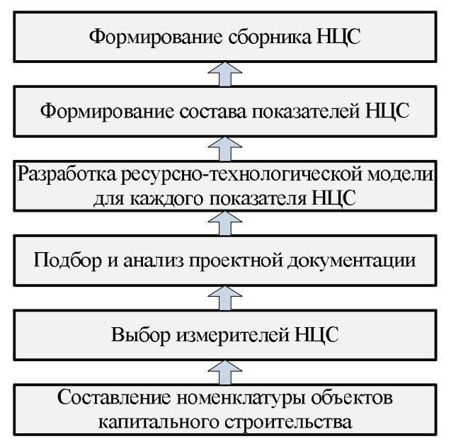
Рис. 1. Общая схема разработки нормативов цены строительства на основе ресурсно-технологических моделей

ния выступают как основные конструктивные элементы зданий и сооружений, так и непосредственно сам продукт инвестиционностроительной деятельности – объект капитального строительства [4, 5].