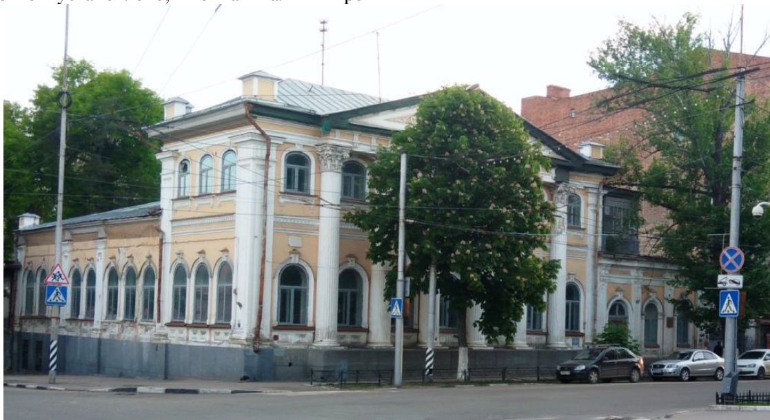
Рис. 1. Общий вид здания

монт обследуемого здания не выполнялся. Производились выборочные косметические ремонты отдельных помещений.