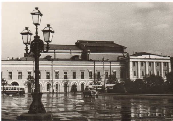
Рис. 3. Вид Театральной площади. Фото конца 40-х гг XX века

Тем не менее, процесс неравномерной осадки здания продолжался, и в конце 80-х гг. XX в. была предпринята еще одна попытка стабилизировать здание (фирма «Бауэр» работы по усилению фундаментов).