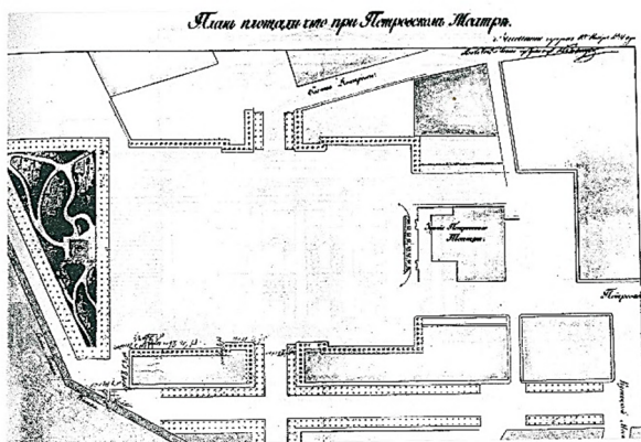
Рис. 1. План площади при Петровском театре, высочайше одобренный 10 ноября 1821 года, арх. И.О. Бове

Так называемая «первоначальная объемная композиция», на самом деле сложилась в три этапа (с 1821 по 1871 год) и в создании этого памятника участвовало несколько равноправных авторов.