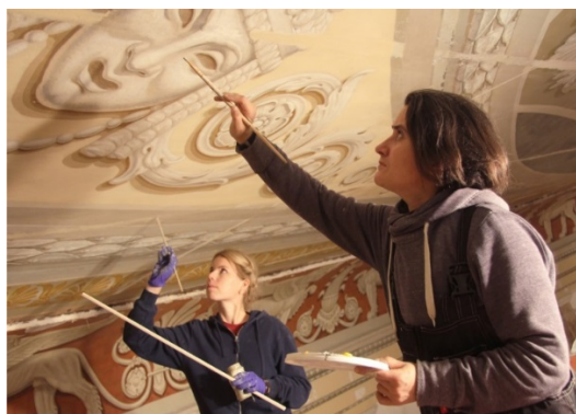
Рис. 5. Работы по реставрации живописи. Фото 2015 года

янно сопоставлялись с расчищенным и отреставрированным живописным убранством зрительного зала, поскольку только таким способом, можно добиться целостного ансамбля. Кроме того, учитывался также и цвет тканевой «одежды зала», интенсивность и оттенок электрического освещения, позолота, цвет паркета и мебели. Материал для финального согласования представлял собой полностью открашенный фрагмент всех элементов интерьера того или иного помещения. И даже на этой стадии, некоторые цветовые нюансы были откорректированы. В частности, все внутренние двери лож выкрашены в цвет стен, для исключения цветовых рефлексов. Архивные фотографии подтвердили правильность данного подхода.