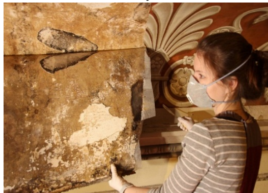
Рис. 4. Состояние холста и основания. Микологические повреждения. Работы по биоцидной обработке штукатурного основания. Фото 2015 года

ходимостью реставрационных работ по деревянному основанию (акустической деки) подтолкнули к принятию трудного решения: проводить реставрацию живописи не «на месте» а в условиях мастерской. Это решение относилось только к живописному плафону. Живописное убранство портала сцены, падуга реставрировались непосредственно с лесов, для чего в зрительном зале созданы особые условия ТВР.