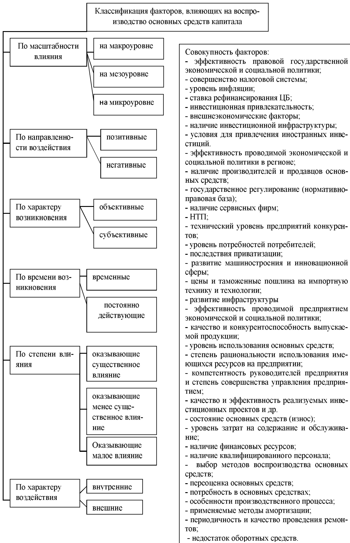
Рис. 1. Классификация факторов, влияющих на воспроизводство основных средств по группировочным признакам