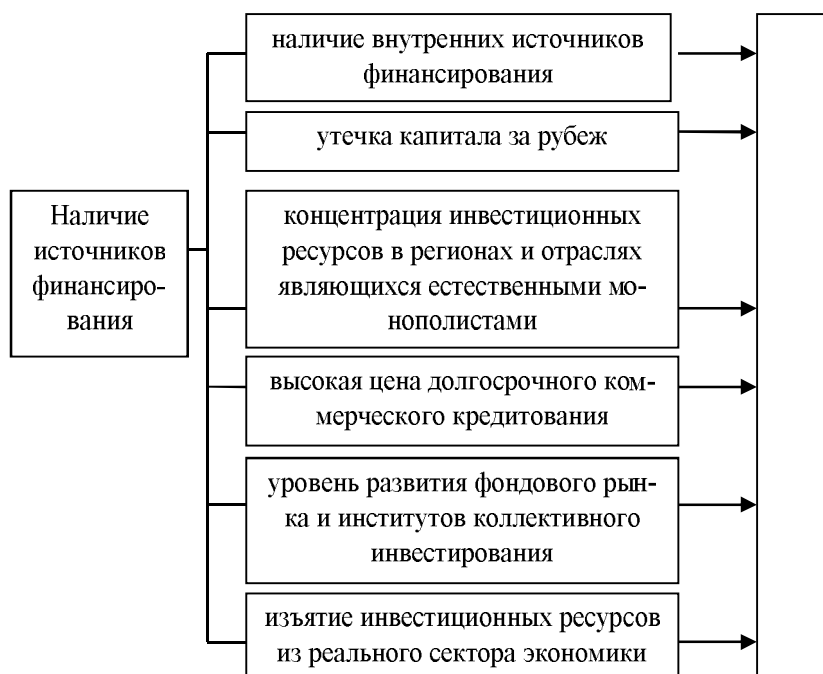
Рис. 3. Механизм влияния наличия источников финансирования на воспроизводство основных средств

10. Замедление и нарушение непрерывности процесса воспроизводственного процесса. Отечественные товары не могут успешно конкурировать с импортными, в том числе из-за морального и физического износа основных средств, то есть средств производства, с помощью которых они производятся, что привело к частичной или полной остановке многих предприятий.