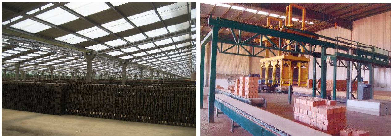
Рис. 5. Процесс производства стенового керамического кирпича из отходов углеобогащения на заводе Хыу Хунг

Выводы. На основе полученных экспериментальных результатов можно сделать следующие выводы: