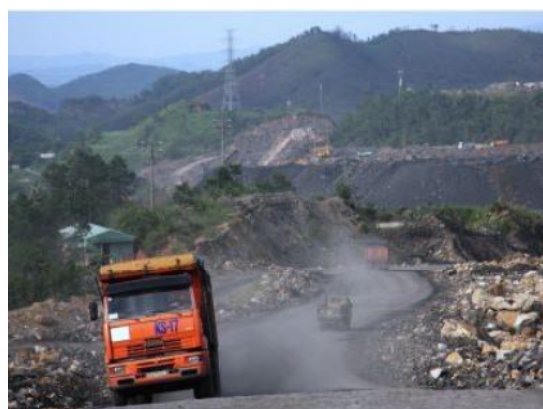
Рис. 1. Загрязнение окружающей среды техногенными отходами добычи угля на разрезах в провинции Куанг Нинь (Вьетнам)

Разведанные запасы угля во Вьетнаме в 2015 году составили свыше 55 \div 58 млн. т. и по прогнозам к 2020 году возрастут до 60 \div 65 млн. т. По имеющимся данным для того, чтобы добыть 1 тонну угля на открытых угольных разрезах Вьетнама необходимо взорвать, погрузить и произвести транспортировку 10 \div 14 м 3 горной породы [8]. Таким образом, к 2020 году количество образовавшихся твёрдых отходов углеобогащения может достичь 600 \div 910 млн. м 3 , что приведёт к значительному экологическому и экономическому ущербу из-за загрязнения окружающей среды и необходимости отведения сотни тысяч квадратных метров площадей для размещения этих отходов.