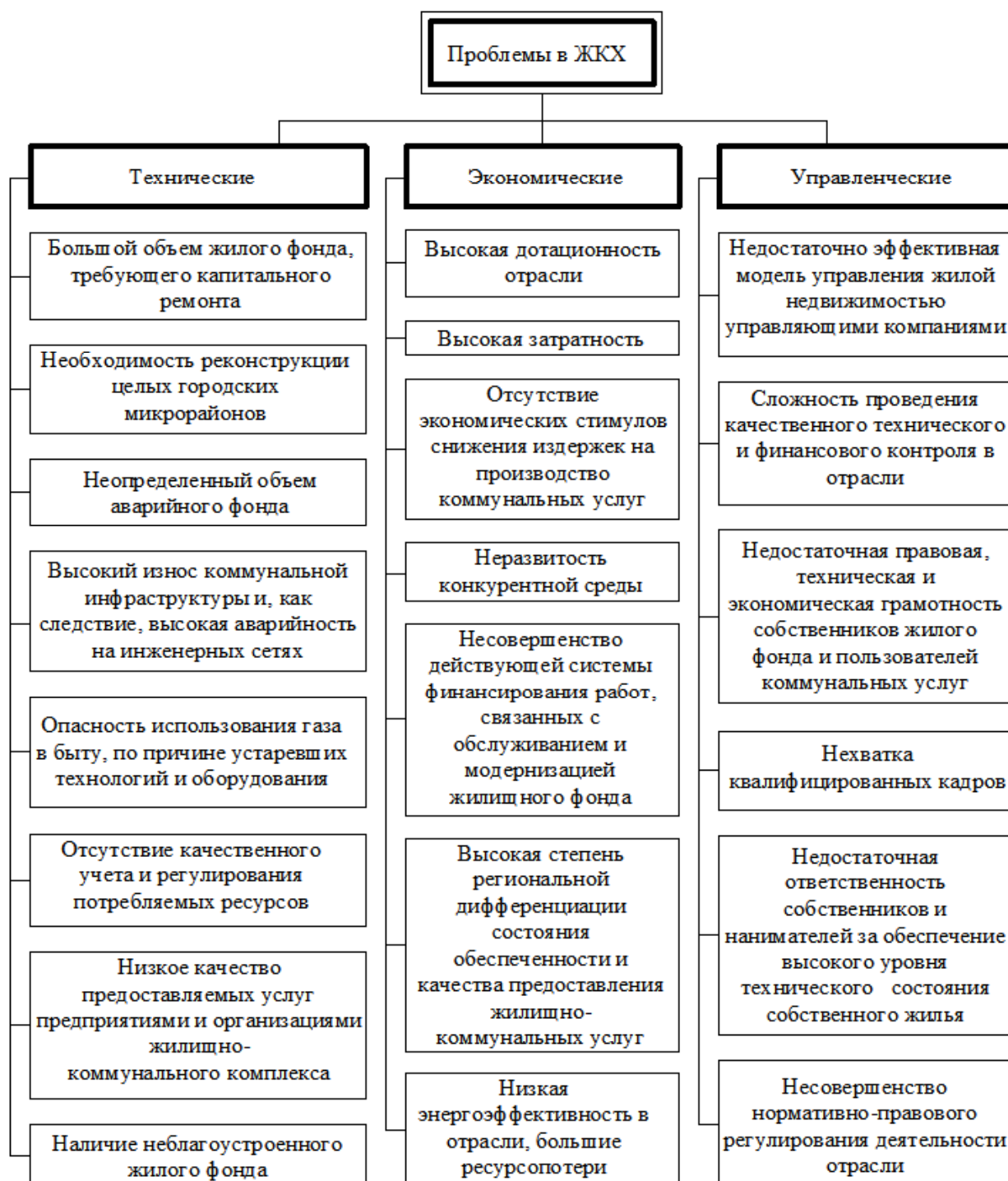
Рис. 1. Основные проблемы ЖКХ

По этой причине на разных уровнях управления необходимо исследовать и ранжировать факторы по степени их взаимовлияния на систему, а также своевременно осуществлять регулирование управляемых параметров для достижения их оптимального сочетания.