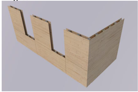
Рис. 2. Фрагмент стены, готовой к укладке бетона в несъёмную опалубку

Фундаментом может служить фундаментная плита, ленточный фундамент (ростверк) или рамный фундамент.