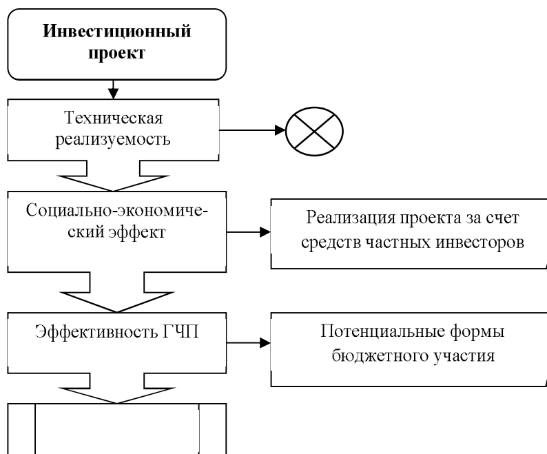
Рис. 2. Порядок первичной оценки инвестиционных проектов для целей ГЧП

Технологическая реализуемость исходит из оценки рисков технологического характера и нормативных ограничений по проекту ГЧП. Эффективность с позиции социально-экономического масштаба – сравнительный анализ плановых и приоритетных документов и показателей. Эффект от реализации проекта ГЧП – оценка «value for money» – когда определяется оптимальная форма участия государственных органов власти в проекте (в частности, государственно-частное партнерство, невмешательство с позиции финансового участия публичной власти, субсидии, госзаказ и другое) [8, 9].