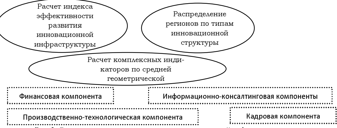
Рис. 2. Совокупные показатели и индексы инновационной инфраструктуры региона.

личных посторонних факторов. Проведя анализ экономической литературы, получены данные об отсутствии систематизации классификаций факторов, потенциально влияющих на инновационный потенциал предприятия. В данной статье обобщена и систематизирована часть классификационных признаков факторов, влияющих на инновационный потенциал предприятий региона, в части промышленного комплекса.