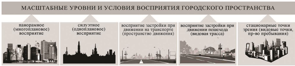
Рис. 4. Масштабные уровни и условия восприятия городского пространства. Сост. Заикина А.С.