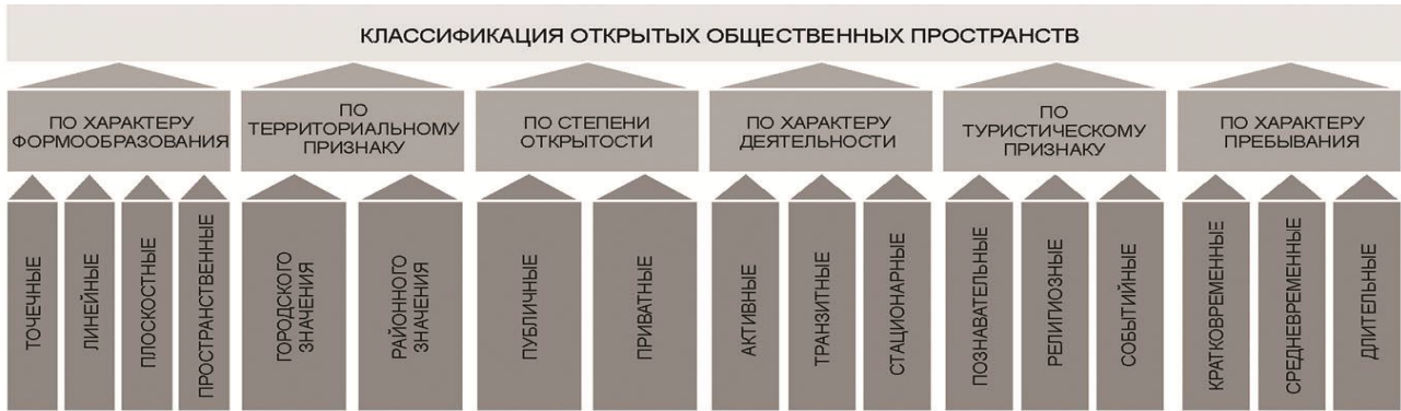
Рис. 1. Классификационные характеристики открытых общественных пространств. Сост. Заикина А.С.

тия), от способа передвижения и т.д. Пространство города характеризуется сложной комбинацией типов городской среды и социумов с различными средовыми ориентациями [9]. Общие рекреационные пространства вдоль градостроительной композиционной оси – малой реки в границах города всегда имеют большое значение для качества среды жизнедеятельности [10].