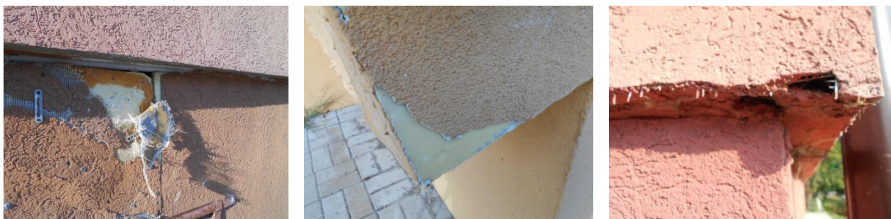
Рис. 1. Дефекты монтажа стеклохолста под штукатурную основу

Зазоры между теплоизоляционными плитами, оставленные без необходимого заполнения материалом утеплителя или заполненные клеевыми составами, герметиками или монтажными пенами и другими неподходящими материалами в достаточно короткий срок приводят к появлению на поверхности декоративно-защитного слоя разрушений в виде хаотично расположенных трещин с последующим локальным обрушением системы (рисунок 1) [4].