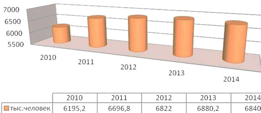
Рис. 2. Общая численность работников малых промышленных предприятий в России за 2010–2014 годы

Средняя численность работников малых промышленных предприятий имеет тенденцию к увеличению до 2013 года, немного снижаясь в 2014 году до уровня 6840,0 тыс. чел. (рис. 2).