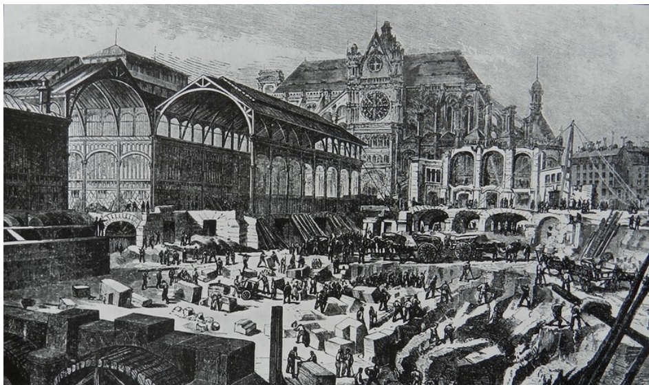
Рис. 4. Здания крытого рынка в Париже архитектор Виктор Бальтар [8]