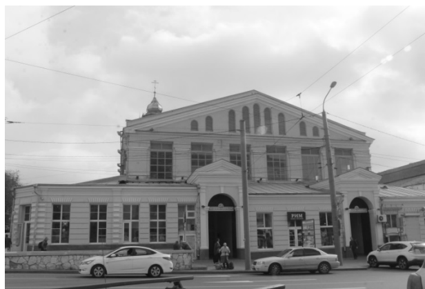
Рис. 1. «Павильон крытого рынка». Вид здания с северо-западной стороны 2018 г.

Основная часть. Здание павильона рассматриваемого Крытого рынка располагается в системе застройки ул. Станиславского и пр. Буденновского по адресу: ул. Станиславского, 56, является частью комплекса торговых строений Старого базара (рис. 1). Композиционная значимость объекта является неотъемлемой частью застройки исторического центра г. Ростова-на-Дону. Павильон крытого рынка является объектом культурного наследия. Особенностью объекта являются его конструкции и объемно-пространственная композиция кирпичного здания, прямоугольной конфигурации в плане, с переменной этажностью, высотой от одного до двух этажей. Архитектурно-художественный облик здания включает в себя доминирующий объем двухсветного зала с примыкающими к нему одноэтажными торговыми ячейками магазинов. Треугольный фронтон торгового зала оформлен парапетами и ритмом разновеликих полуциркульных оконных проемов в тимпанах.