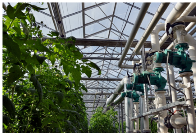
Рис. 3. Фотографии теплицы в городе Вологде

Производственная теплица (объект теплопотребления) (рис. 3) подключена к системе централизованного теплоснабжения от районной отопительной котельной, которая является также собственностью организации (ОАО «Совхоз «Заречье»», г. Вологда). В качестве теплоносителя в системе используется вода из городского водопровода. Отопление теплиц осуществляется за счет системы теплоснабжения с дополнительным водообеспечением из баков тепличного комбината. Котельная установка подключена к магистральному газопроводу среднего давления. Водяная тепловая сеть двухтрубная, по типу прокладки