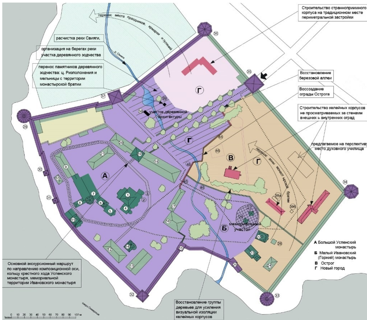
Рис. 3. Генеральный план и предложения по реконструкции и развитию Кирилло-Белозерского монастыря

Никоновской башни с ее восточного фасада на западный – на сторону зоны обслуживания паломников и туристов. Целесообразно использовать северные и южные хозяйственные ворота только для нужд самого монастыря. Следует также создать внутренние ограждения, которые позволят выделить территорию, предназначенную только для монахов и послушников.