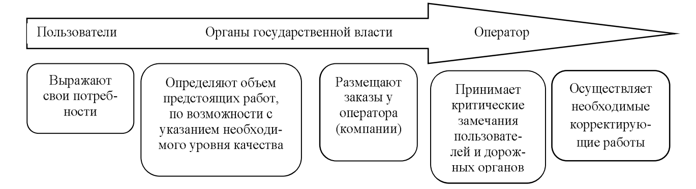
Рис. 2. Схема ГЧП проектов

Во второй схеме дорожные администрации отвечают за организацию свободного выражения мнений общественностью и (или) пользователями дорог (книги жалоб, проверки и т.д.). Это является одной из задач регулирования (технические аспекты).