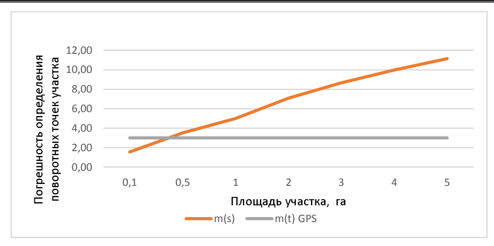
Рис. 2. График зависимости погрешности определения площади участка от погрешности определения координат его вершин «бытовым» GPS-приемником

В табл. 1 приведены данные, характеризующие точность определения положения пово-