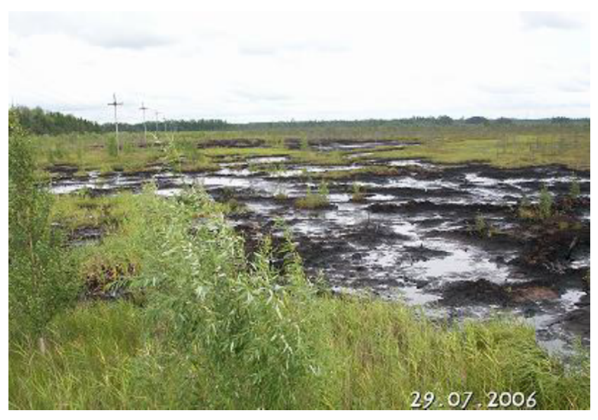
Рис. 1. Нефтезагрязненный участок, подлежащий рекультивации

Из множества способов определения координат поворотных точек участка применяется аналитический способ, основанный на использовании GPS-приемников. Максимально возможная точность определения координат в горизонтальной плоскости составляет 2-3 метра (при условии хорошей видимости небосвода) при применении «бытовых» GPS-приемников.