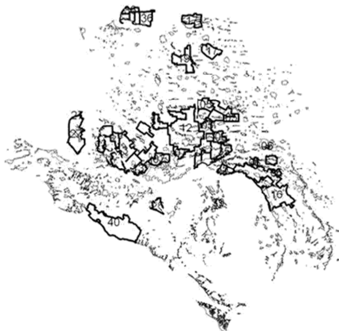
Рис. 3. Картографическое отображение границ Краснодарского края, сведения по которым содержатся в ГКН