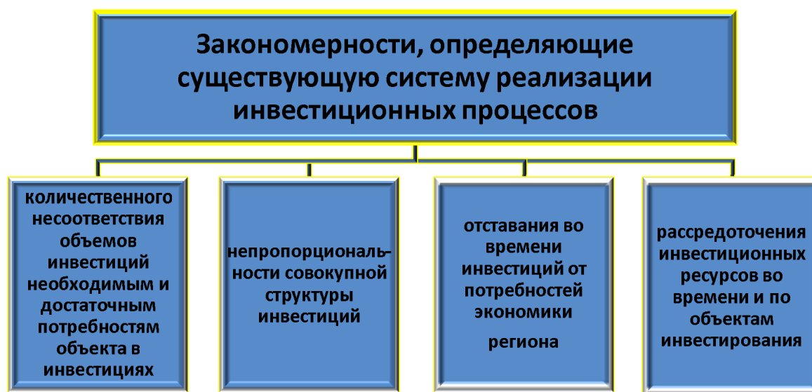
Рис. 2. Закономерности, определяющие существующую систему реализации инвестиционных процессов

Исходя из комплексного рассмотрения вышеприведенных особенностей как проявление негативных факторов реализации инвестиционных проектов, возникающих в процессе недостаточного регулирования последнего с точки зрения государственных интересов и целей развития общества в целом, а так же в результате анализа существующих региональных инвестиционных программ административных территорий, подпадающих под статус ресурсодефицитных и не дотационных были предложены закономерности [1], определяющие существующую систему реализации инвестиционных процессов (рис. 2).