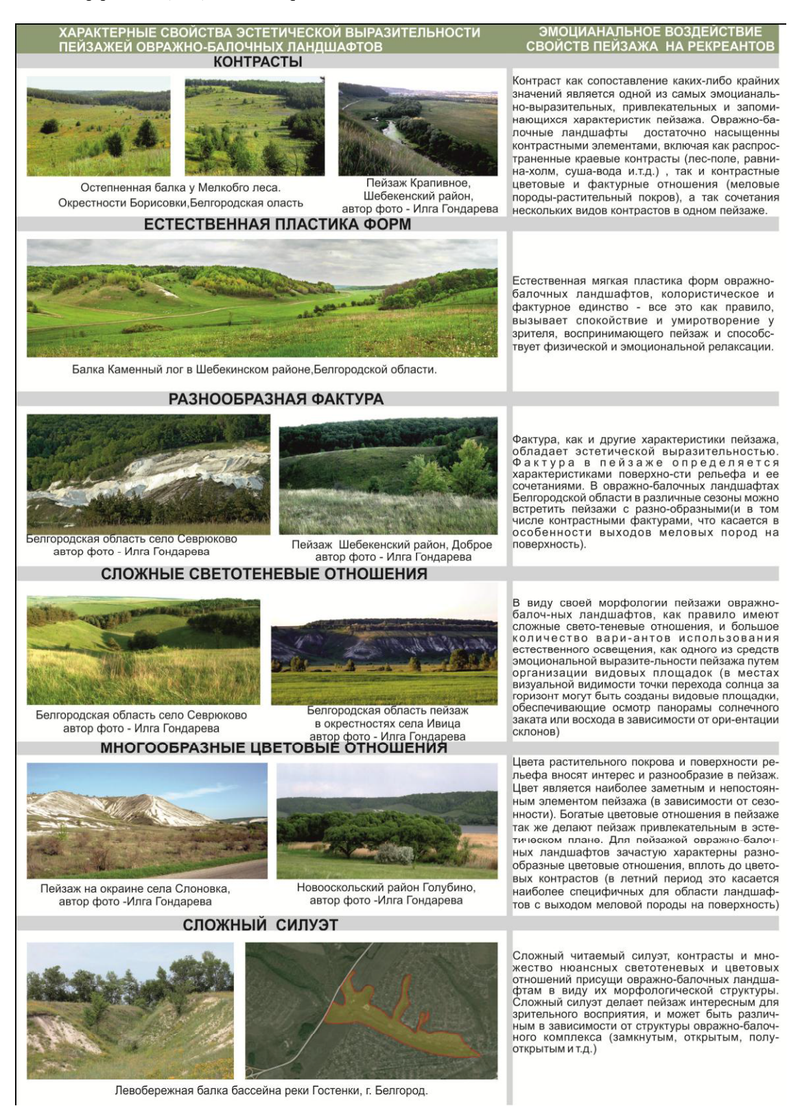
Рис. 3. Характерные свойства эстетической выразительности пейзажей овражно-балочных ландшафтов и их эмоциональное воздействие на рекреантов. Сост. Крушельницкая Е.И

товые отношения ( в виду разнообразия растительного покрова); б) сложный ассиметричный силуэт ( силуэт овражно-балочных комплексов может быть различным: замкнутым, полузамкнутым, разомкнутым и.т.д).