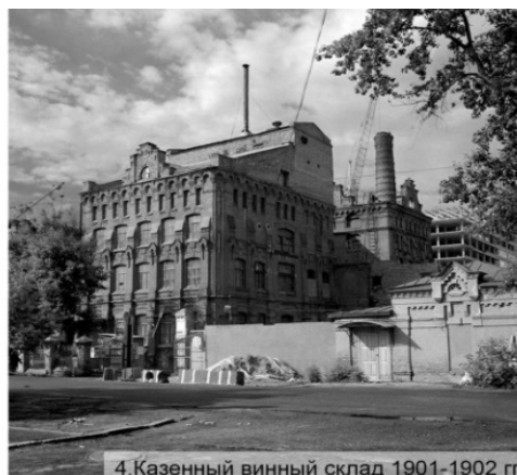
4. Казенный винный склад 1901-1902 гг.