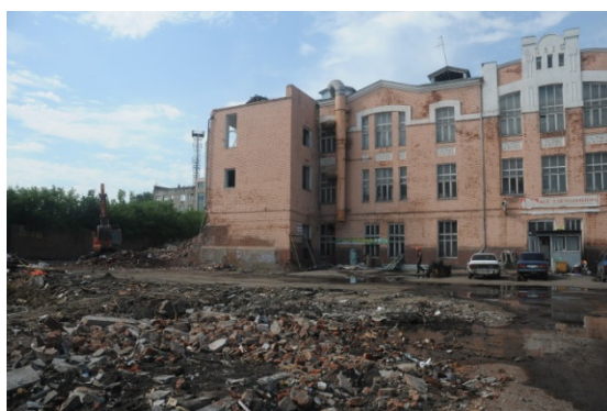
Рис. 4 Сохранившиеся, часто в руинированном состоянии объекты

Стоит отметить, что промышленные постройки XIX-нач. XX вв. отличаются архитектурным своеобразием. При том, что преимущественно строились эти здания по типовым проектам, инженеры того времени утилитарные технические сооружения старались вписать в застройку. Они были построены в основном из красного кирпича с пластически богатыми фасадами, напоминая средневековую крепостную архитектуру, чем промышленные предприятия (рис. 4). В наше время сохранившиеся, часто в руинированном состоянии объекты имеют живописный романтический облик.