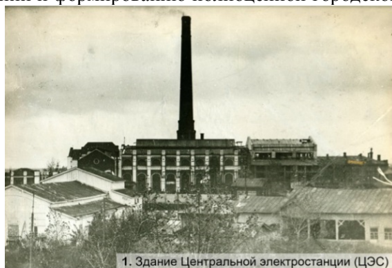
1. Здание Центральной электростанции (ЦЭС)

В это время стали приезжать представители зарубежных фирм, деятели культуры и архитекторы из Москвы и С-Петербурга; строятся Торговые московские ряды на Любинском проспекте, магазины, торговые лавки и промышленные предприятия. До наших дней сохранились не многочисленные, но ценнейшие промышленные комплексы рубежа веков, что дает поле для научных исследований и практической конверсии. С началом научной работы было установлено, что зачастую объекты полностью утрачены, некоторые перестроены до неузнаваемости, другие сохранили лишь часть корпусов в измененном виде. Одним из примеров является Центральная электростанция на периферии 2й Омской крепости. В советский период, когда требовалось увеличение производственных мощностей, к ней были пристроены дополнительные корпуса, увеличена этажность, вследствие чего изменилась первоначальная композиция фасадов. В 2008 году часть зданий советского периода была демонтирована (рис. 2.).