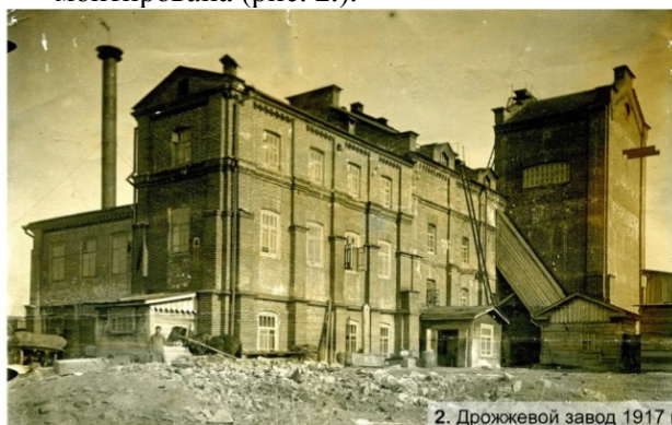
2. Дрожжевой завод 1917 г