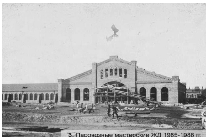
3. Паровозные мастерские ЖД 1985-1986 гг.