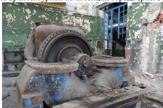
Рис. 5. Турбинный зал Центральной электростанции. Часть сохранившегося оборудования турбинного зала. Фото из личного архива

Они были передовыми для своего времени как по техническому оснащению (было электричество, трамвайная или ж/д ветка), так и в отношении архитектурного облика, являясь городской доминантой среди частной одноэтажной застройки Омска и в полной мере служили основой для архитектурной композиции города (рис. 5).