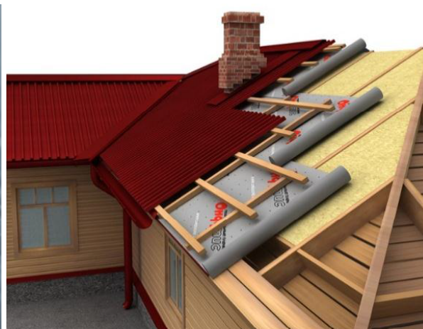
Рис. 1. Применение диффузионных мембран

Современный рынок строительных материалов предоставляет широкий выбор диффузионных мембран, однако, по результатам исследования, лучшие показатели паропроницаемости, водонепроницаемости и разрывной нагрузки