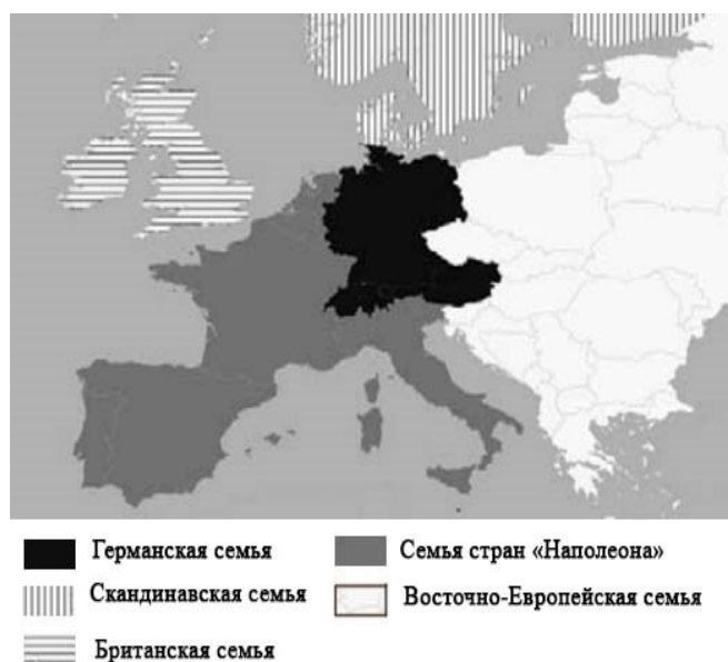
Рис. 2. Деление стран мира на «семьи» по типам зонирования и градорегулирования, согласно классификации Ньюмана и Торнли [4].