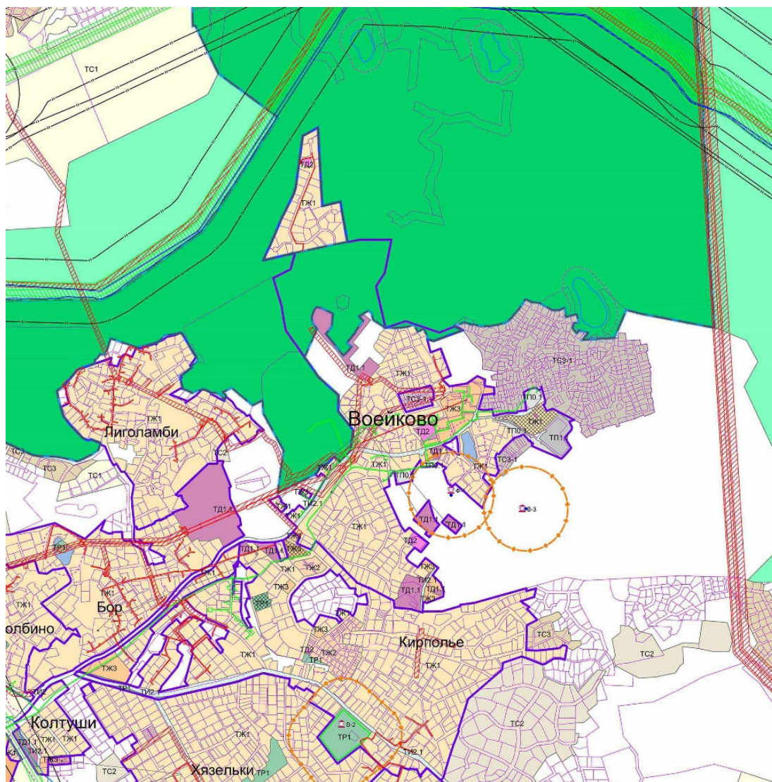
Рис. 4. Фрагмент правил землепользования и застройки Колтушского сельского поселения [20]

Первый принцип – полифункциональное зонирование территории с выделением приоритетных функций. Так, например, если на территории находятся участки жилого, общественного, рекреационного и коммунального назначения, то возможно установление именно такого наименования функциональной зоны: жилая-общественная-рекреационно-коммунальная, при этом ограничения по развитию находятся внутри параметра территориальной зоны. Значимость каждой функции при этом должно определяться через максимальный суммарный показатель предельного фонда застройки. Полифункциональное зонирование территории подразумевает необходимость подготовки проектов планировки больших территорий за счет бюджета с целью проработки уточненных параметров зонирования территории. Такое решение иллюстрируется подготавливаемым на данный момент Единым документом федеральной территории «Сириус» [21]. В этом документе границы функциональных зон