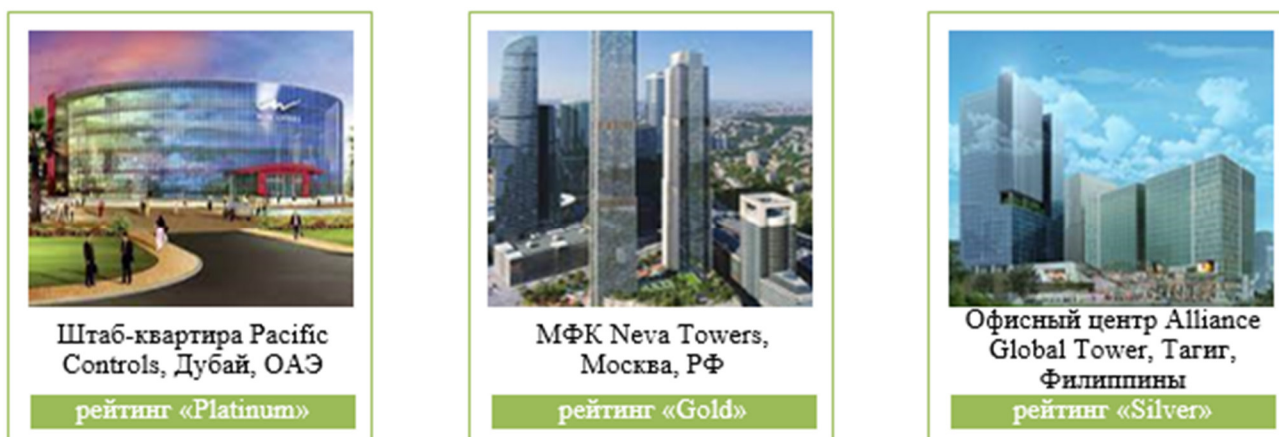
Рис. 2. Примеры сооружений, сертифицированных по системе LEED

Несмотря на то, что система стандартов DGNB является результатом работы большой команды экспертов (архитекторов, строителей, исследователей и консультантов), представители рынка строительства, а именно бизнесмены и технические специалисты, как правило, не приглашаются к участию ни в процессе оценки зданий на соответствие, ни к регулярной работе над усовершенствованием нормативов [12]. Учитывая тот факт, что стандарт предписывает тщательную проработку экономических обоснований проекта, это обстоятельство создает определенный вакуум для качественного взаимодействия всех заинтересованных участников [13].