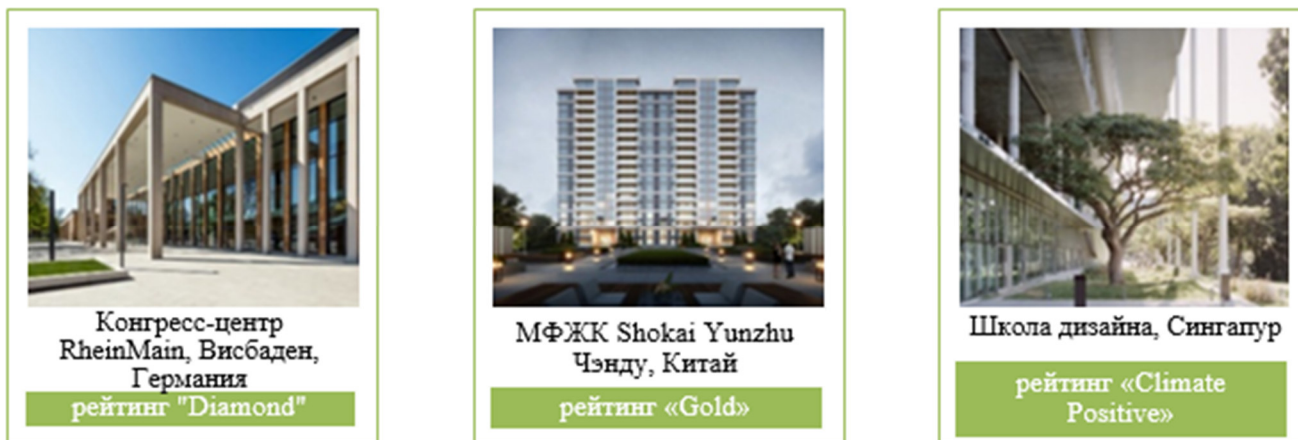
Рис. 3. Примеры сооружений, сертифицированных по системе DGNB

половина выданных сертификатов – порядка 120 тысяч [17].