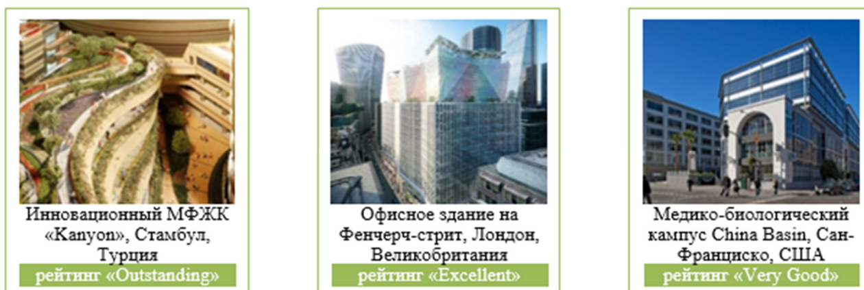
Рис. 1. Примеры сооружений, сертифицированных по системе BREEAM

Независимая оценка качества зданий международным экспертным сообществом (третьей стороной) обеспечила стандарту BREEAM широкое рыночное применение. Благодаря тому, что система сертификации BREEAM признает одобренные национальные строительные нормативы, в течение последующих лет этот она была успешно адаптирована в других странах. На основе стратегии BREEAM были разработаны стандарты экологического строительства в Канаде, Китае и Новой Зеландии.